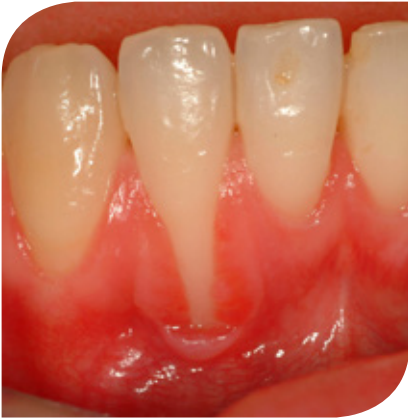
Voor de behandeling