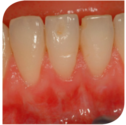
Na de behandeling

Als het tandvlees terugtrekt, komt de tandwortel bloot te liggen. Dit tandbeen is zachter dan tandglazuur, waardoor er sneller gaatjes kunnen ontstaan. Omdat de uitlopers van de tandzenuw zich in het tandbeen bevinden, is het tandbeen niet beschermd en daardoor gevoeliger voor warm, koud, zoet of zuur. Tandenvoetsen kan gevoeliger worden, waardoor de blootliggende tandhals moeilijker schoon te houden is. De wortel is ook anders van kleur dan het tandglazuur en verkleurt sneller, waardoor het er niet altijd even mooi uitziet.